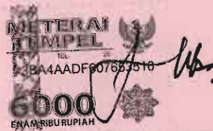
WAKIDJO BUDI SISWANTO Bin NOYODIMEJO